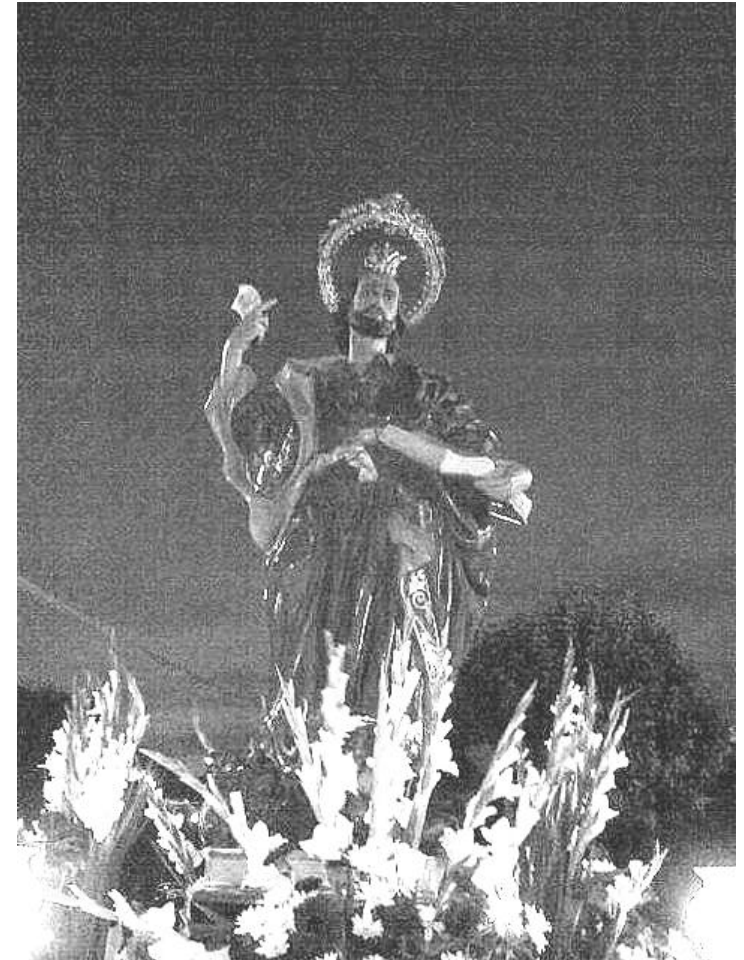
Procesión San Bartolomé 1979