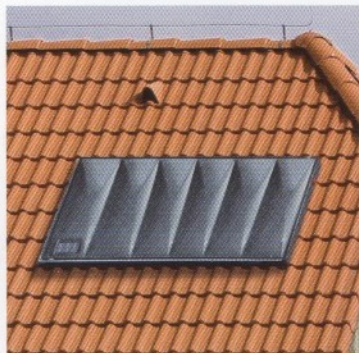
Encastrado en el tejado

Adaptable según las necesidades de instalación. No ocupa espacio en la vivienda.