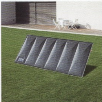
Sobre jardín o terraceza plana