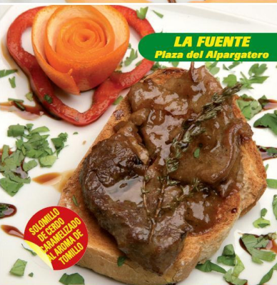
LA FUENTE Plaza del Alpargatero

SOLMILLO DE CERDO CON BARRILADO AL HORNO Y DE TOMILLO