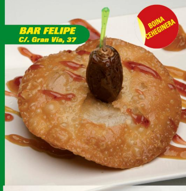
BAR FELIPE C/. Gran Vía, 37