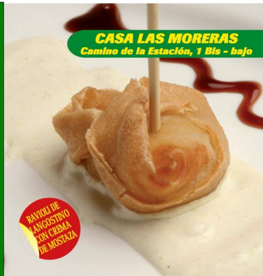
CASA LAS MORERAS Camino de la Estación, 1 Bis - bajo