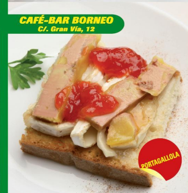
CAFÉ-BAR BORNEO C/. Gran Vía, 12