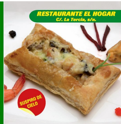
RESTAURANTE EL HOGAR C/. La Tercia, s/n.