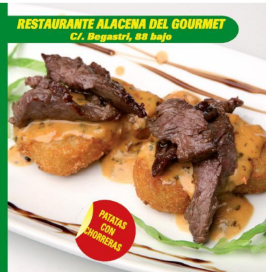
RESTAURANTE ALACENA DEL GOURMET C/. Begastri, 88 bajo