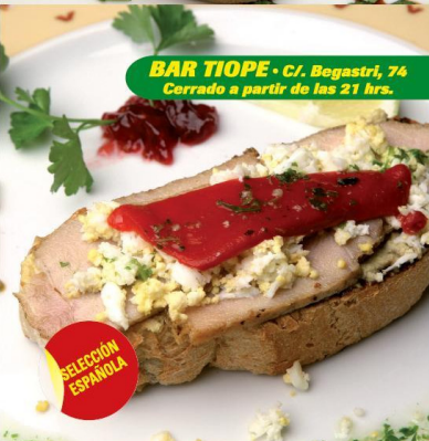
BAR TIOPE · C/. Begastri, 74 Cerrado a partir de las 21 hrs.