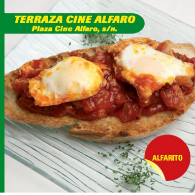
TERRAZA CINE ALFARO Plaza Cine Alfaro, s/n.