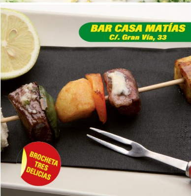
BAR CASA MATÍAS C/. Gran Vía, 33