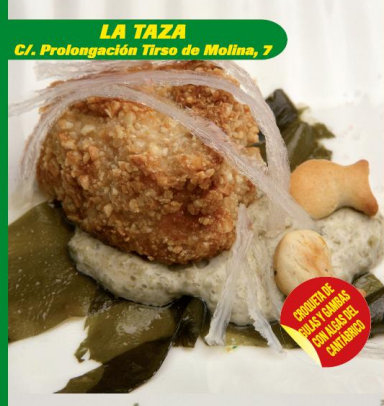
LA TAZA C/. Profundación Tirso de Molina, 7

BOVEDA DE SOLAS TUMBAS CON TACOS DEL SANTIBARRIO