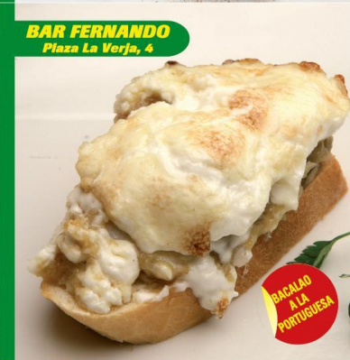
BAR FERNANDO Plaza La Verja, 4