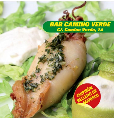
BAR CAMINO VERDE C/. Camino Verde, 14