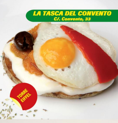
LA TASCA DEL CONVENTO C/. Convento, 33