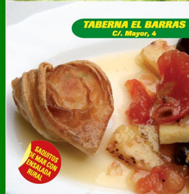
TABERNA EL BARRAS C/. Mayor, 4