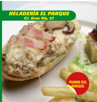
HELADERÍA EL PARQUE C/. Gran Vía, 27