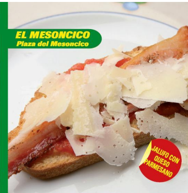
EL MESONCICO Plaza del Mesoncico