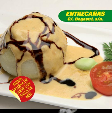
ENTRECAÑAS C/. Bogastrí, s/n.

PATATA RELLENADA DE CARNE CON SALSA DE MIEL