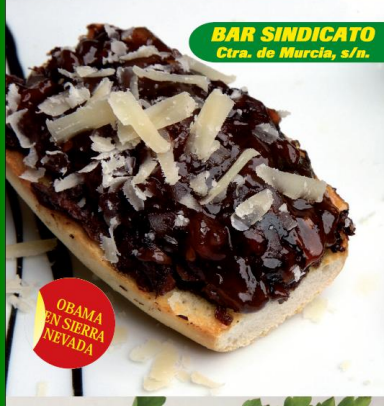
BAR SINDICATO Ctra. de Murcia, s/n.

BOVEDA DE SOLAS TUMBAS CON TACOS DEL SANTIBARRIO