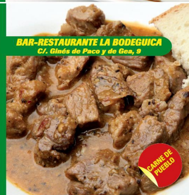
BAR-RESTAURANTE LA BODEGUICA C/. Ginés de Paco y de Gea, 9

SOLMILLO DE CERDO CON BARRILADO AL HORNO Y DE TOMILLO