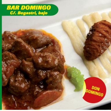
BAR DOMINGO C/. Bogastrí, bajo