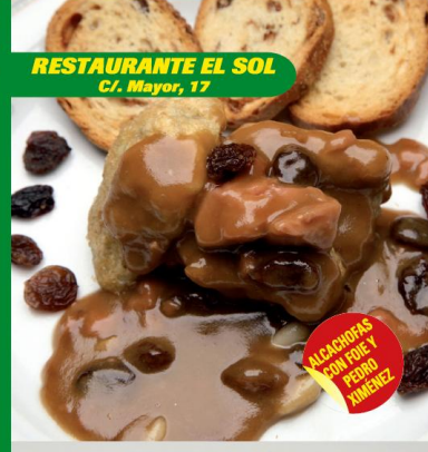
RESTAURANTE EL SOL C/. Mayor, 17