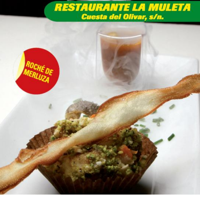
RESTAURANTE LA MULETA Cuesta del Olivar, s/n.