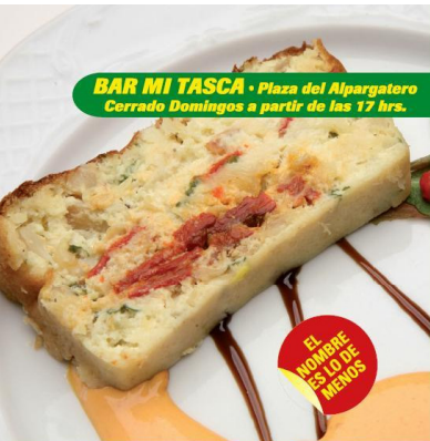
BAR MI TASCA · Plaza del Alpargatero Cerrado Domingos a partir de las 17 hrs.