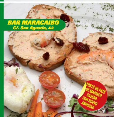
BAR MARACAIBO C/. San Agustín, 43

TOSTÁ DE PATÉ DE MARISCO CASERO CON HUEVO ARRUGAO