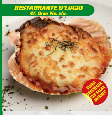
RESTAURANTE D'LCUCIO C/. Gran Vía, s/n.

PATATA RELLENADA DE CARNE CON SALSA DE MIEL