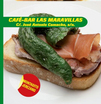
CAFÉ-BAR LAS MARAVILLAS C/. José Antonio Camacho, s/n.