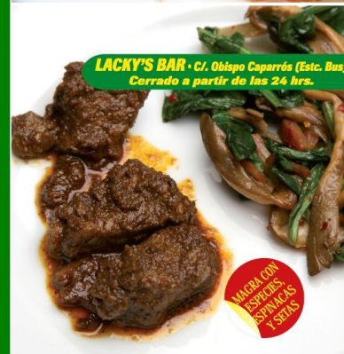
LACKY'S BAR · C/. Obispo Caparrós (Estic. Bus) Cerrado a partir de las 24 hrs.

TOSTÁ DE PATÉ DE MARISCO CASERO CON HUEVO ARRUGAO