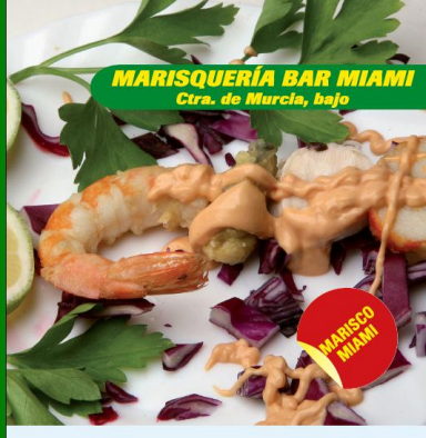
MARISQUERÍA BAR MIAMI Ctra. de Murcia, bajo