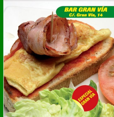
BAR GRAN VÍA C/. Gran Vía, 14