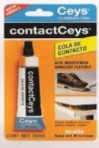
503401 30 ML. 503402 70 ML.

Disponible en tubos de 30 y 70 ml; botes de 125, 250, 500, 1000 ml