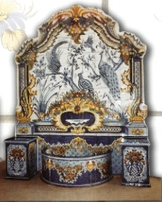
REF.: F. PAVOS 1,65 X 2,30M (66X98 INCHES)