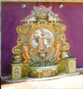
REF. FT. 8 - 2,20X2,40 M (87X94 INCHES)