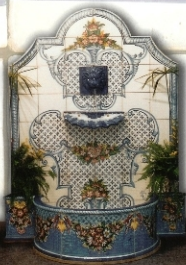
REF.: FCSA 1,20 X 1,60 M (47X63 INCHES)