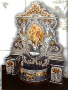
REF.: FT 7 - 150X200 CM (60X79 INCHES)