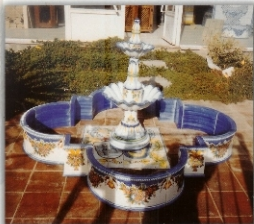
REF. FTC23 - 2X115 M (79X45 INCHES)