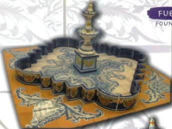
RÉF. FTC. A. 25 - 4X2 M (157X79 INCHES)