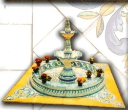
R&F. FT100 - 2X1,35 M