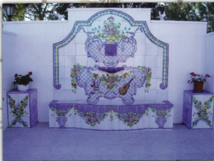
REF.: FT.II - 2X2 M. 09X79 INCHES