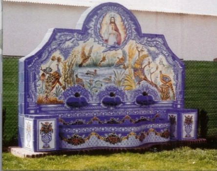
REF.: FUENTE ESPECIAL Nº 3