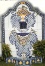
REF.: FN 2 + 1,20X1,60 M (47X63 INCHES)