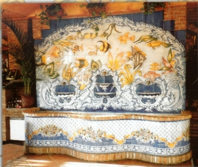
REF. FT 10 - 3X2,40 M (10X894 INCHES)