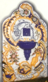
REF.: FLS 1,20 X 2,00 M (47X63 INCHES)