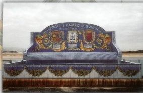
REF. FT. DESALADORA