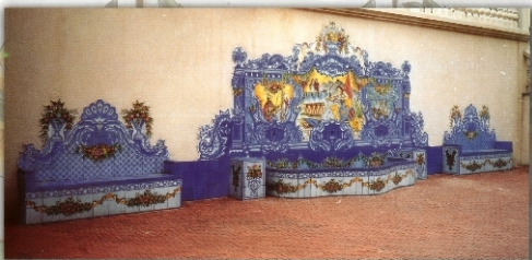
REF. FT. ORIBUJA CON BANCOS