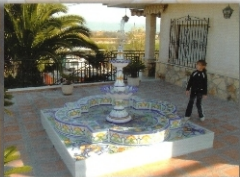
REF.FTA.A.26 - 2X115 M (79X45 INCHES)