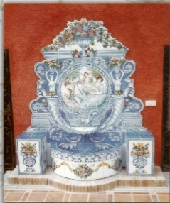
REF. FT. 8 - 165X2,30 (65X91 INCHES)