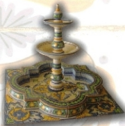
REF.: FTC 22 - 1,20X1,15 M (47X45 INCHES)