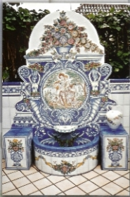
REF.124 - 150X170CM (60X67 INCHES)