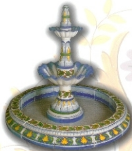
REF.: 24 - 1,80 X 1,15 M (70x45 INCHES)