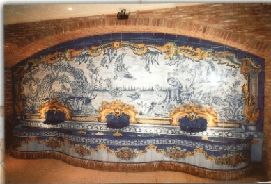
REF. FT 8 - 4X2 M (137X79 INCHES)