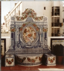
REF.: FT 1 - 2,20X2,40 M (87X94 INCHES)