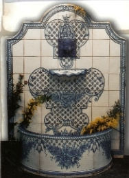
REF.: FCS 1,35X1,05 M (43X34 INCHES)