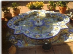
REF.: FTC GRANADA 2X0,40 M (79X16 INCHES)