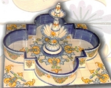
REF.: FTC.A21 - 2 X 1,15 M (79X45 INCHES)