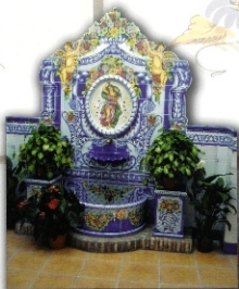
REF. FT3 1,65X2,30M.