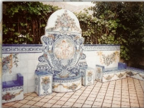
REF. FL. 4 - 2,20X2,40 M (87X94 INCHES)