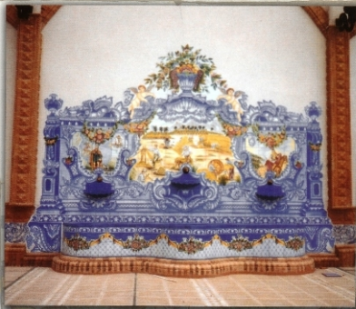
REF.: F. ESPECIAL 4,20 X 2,60 M 065X10 IN C/CD