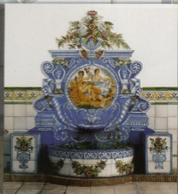
REF.: F14 - 2,00 X 2,35 M (80X93 INCHES)