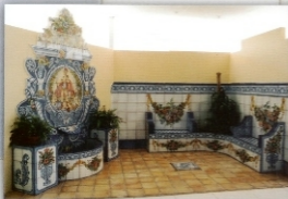
REF.: PATIO MURCIANO