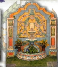
REF. ROMANA 2X2 M 69X79 INCHES