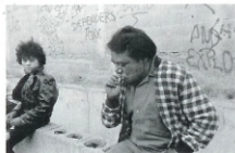
"Bachú", Málaga, D.F. 1989