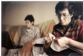
"Mis generaciones y un cáncer". Málaga, 2007

De fuera adentro y desde dentro, he volcado en este trabajo mi universo más íntimo y querido. En este recorrido visual en femenino, a través de mi familia y experiencia, desarrollo un álbum fotográfico que trasciende lo concreto, que rebasa fronteras consanguíneas, culturales y cronológicas, que se adentra en el día a día de una generación de mujeres nacidas en la posguerra. Basado en el poder de evocación de la fotografía y la fuerza de lo sentido, recorro con mi cámara los rincones de un mundo que es, simultáneamente, origen y tránsito: la casa, la limpieza, el marido, la hija, la misa, la cocina, el cotilleo, el folclore, la tradición, la cruz... Y también, un pensamiento que flota en el aire: cuán diferente sería la vida si se tuviera otra oportunidad, sabiendo lo que ya se sabe. ¿Serán nuestros pecados los mismos que ellas cometieron?