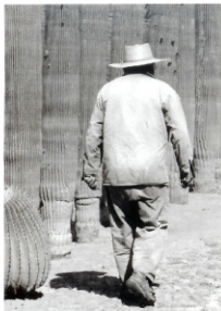
"Vivir con la espina del tiempo". 2003

La diversidad social sin duda existe, pero más allá de la misma prevalece la marginación y la desigualdad. Sin embargo, queda la duda sobre los sueños y la felicidad de las personas que habitan ese México diferente, aquel lejano al progreso, a la modernidad urbana y al crecimiento de las ciudades con las características que parece exigir la primera década del siglo XXI.