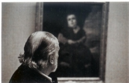
"Ramón Gaya con uno de sus hijos de Valencia." de Valencia. Madrid 1987