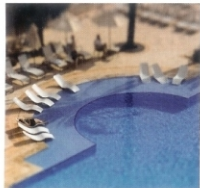
Da Vivencias simultáneas 833. Región de Murcia, 2009