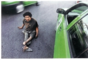
De El fotógrafo taxista: las calles de Monterrey, México, 2008

Curiosidad vital, inteligencia visual innata, sensibilidad y una gran humanidad, hacen que las fotografías de Óscar Fernando Gómez contengan una de las miradas más limpias e inteligentes que hemos visto en la fotografía en los últimos años. Él fotografía lo que ve, pero lo que ve y cómo lo fotografía nos interesa a todos. Ese es el matiz y la diferencia. Su mirada no está contaminada ni por la cultura fotográfica, ni por "lo que debe fotografiarse", ni por intereses mediáticos. Es visualmente puro y nos enseña un mundo de belleza y de dolor, de humanidad y desafecto, con toda naturalidad, sin prejuicios, con amor. Y además le gusta autorretratarse con las personas que fotografía.