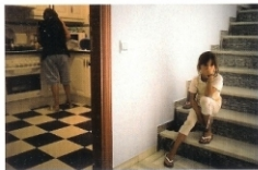
"Escritoras y escritores", Huelva, 2008