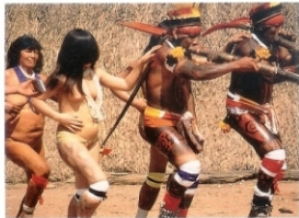
De Altoxinguanos. MBI-Goselo, Bisel. 2008

En la amazonia brasileña, al norte del Mato Grosso, se encuentra la Tierra Indígena de Xingú, una reserva natural bañada por el río Xingú, uno de los principales afluentes del Amazonas. En la cabecera de este río y sus tributarios se localiza la cultura alto xinguna, formada por diversos grupos humanos que hablan distintas lenguas pero de idénticas costumbres; primigénicas y espectaculares tradiciones que son el factor de equilibrio entre el Hombre, la Naturaleza y los Espíritus. Se trata de una representación de los mitos que explican el origen de la humanidad. Este rito homenajea a los muertos y celebra la vida con las espectaculares luchas cuerpo a cuerpo donde los mejores guerreros, mezclando la habilidad, la fuerza, y las creencias animistas, se enfrentan -tras arañar sus cuerpos para aplicarse el ungüento secreto que les fortalece los músculos- desnudos, bellamente pintados y ornamentados con plumas, adornos y accesorios de clara influencia occidental. El ritual del Kuarup se celebra durante la estación seca y únicamente cuando fallecen una o varias personas de la jerarquía del cacique a cuyos espíritus se les desea un buen viaje por medio de danzas, cánticos, música de flautas, luchas y la liberación de mujeres cautivas para la procreación.