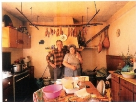
"Sala 47", Portugal 2002

En este proyecto Teunissen dirige su mirada hacia lo rural, estableciendo una fuerte relación de complicidad con las personas, lo que le permite entrar en su privacidad y fotografiarlas con gran naturalidad. Paisajes domésticos es una invitación al espectador para saborear y valorar la riqueza y autenticidad de los personajes, de su entorno doméstico y de su iconografía social, en un mundo de enorme interés antropológico, cada vez más al borde de la extinción. Teunissen construye sus escenas con composiciones muy sencillas, pero estudiadas cuidadosamente, toma las imágenes con la luz natural disponible esperando al momento adecuado para conseguir unas obras de gran belleza, llenas de drama y nobleza. La obra Paisajes domésticos de Teunissen es un recorrido por distintos países. La exposición que presentamos aquí está integrada por las imágenes que hizo en Portugal y que se presentó por primera vez en el Museo de la Imagen de Braga.