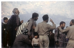
De Éxodo en Kurdistán. Irán, 1991

En marzo de 1991 las tropas de la coalición liderada por Estados Unidos para desalojar a Sadam Husein de Kuwait dieron por terminada su ofensiva en territorio iraquí, a unos 150 kilómetros al sur de Bagdad. El régimen baasista sobrevivió. Animados por la debilidad militar iraquí durante el ataque internacional, las poblaciones descontentas con el dominio suní y baasista se rebelaron, al socaire de la derrota del ejército de Sadam. Los chiíes, en el sur, y los kurdos, en el norte, se alzaron en armas. Sin embargo, las fuerzas reservadas por Sadam Husein le sirvieron para reprimir salvajemente las revueltas inconexas kurda y chil. Al norte, en Kurdistán, la represión fue brutal. En el sur, también. Las ciudades kurdas fueron escrupulosamente "peinadas" en busca y captura de rebeldes. Las montañas kurdas fueron bombardeadas a conciencia. Turquía, que también observaba un reavivamiento del independentismo kurdo, cerró su frontera, dejando atrapados a millones de kurdos iraquíes. Un millón trescientos mil kurdos iraquíes huyó a través de las montañas en dirección a Irán, que abrió sus fronteras de la provincia de Sherdnast para acoger uno de los mayores éxodos del siglo XX. La catástrofe humanitaria fue tremenda, a pesar de que Irán consiguió ayuda internacional de ACNUR para hacer frente a la marea humana que llegó a su territorio. Las imágenes muestran escenas de los primeros días del éxodo de los kurdos iraquíes y su entrada en el Kurdistán iraní.