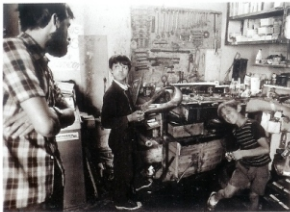
Fines trabajadores en un taller escénico en el distrito de Hortaleza, Madrid. 1976

Cocinero antes que fraile , cuando Manuel López creó en 1982 la revista FOTO, ya tenía tras de sí una dilatada experiencia como periodista todo terreno, editor gráfico, director de revistas, profesor... y fotógrafo. ML ha dedicado la mayor parte de su trayectoria profesional a editar fotografías de otros autores, relegando a un segundo plano las suyas propias, tanto las que había hecho como las que continúa haciendo.