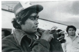
"Compañeros", 1996 © PABLO ORTIZ MONASTERIO