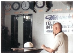
De la serie Robados, 2008. © Carlos Pazos Cortés García La Aurora

Carlos Pazos, tras realizar varios trabajos en los que el discurso artístico recaía sobre sí mismo decidió, en 1975, presentarse a través de un alter ego definido por los deseos autobiográficos de casi todo el mundo. Con Voy a hacer de mí una estrella la idea de exhibirse reunió al yo personal con el yo estrella y se colocó en la posición enigmática del rechazo a todo contacto con el entorno real. De esta forma Pazos asumió múltiples personalidades del star system con lo que declaraba su versatilidad. En Robados , 2008, Carlos Pazos, 33 años después del nacimiento de la estrella, vuelve a enfundarse en el personaje. En este caso, sin embargo, no asume una personalidad ajena, sino que actúa como la estrella en que se convirtió a raíz de su voluntad de serlo. Se nos muestra como el individuo que pierde el poder de control sobre sí mismo, sobre su imagen y sobre lo que quiere o no que trascienda de sí mismo. Ya no busca el glamour de la estrella, sino su lado personal. Esa zona íntima que queda al descubierto se quiera o no, en la fuga continua de los paparazzi que lo persiguen. La serie Robados es una selección de fotografías tomadas en Bali y Singapur, durante unas vacaciones del Pazos estrella. Reflejan la persecución del famoso por parte de los fotógrafos, en el intento de captar la instantánea que nos muestre la decadencia física y sus esfuerzos por esconderse y desaparecer del papel couché. Estas imágenes están realizadas con la colaboración fotográfica de Joana Roselló.