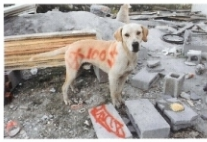
"Autoretrato" (Arriba) y De El fotógrafo taxista las calles de Monterrey, México, 2008 © OSCAR FERNANDO GÓMEZ

En marzo de 2009 en México D.F., los fotógrafos y amigos Gerardo y Fernando Montiel Klint y Francisco Mata Rosas, me hablaron de un taxista fotógrafo de Monterrey, al que Gerardo había descubierto dando un taller, con el