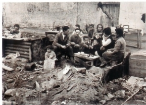
"La alegría de vivir", 1986

José Miguel de Miguel es el prototipo de fotógrafo aficionado de posguerra: buen conocedor de la técnica, finísimo positivador y asiduo de la Agrupación Fotográfica de Valencia. Con esta trayectoria se podría esperar de él una obra plagada de tópicos o una obsesión por realizar aquellas fotos preciosistas que ganaban los concursos. Y aunque es innegable que se volcó en este ámbito y obtuvo los mejores reconocimientos de la época, tuvo una virtud personal y creativa que imprime un carácter extraordinario a toda su obra: un innato sentido del humor. Un humor ingenioso y vitalista que recorre toda su obra: es el caso de sus magistrales puestas en escenas casi cinematográficas, que están a menudo en el filo de lo exagerado sin sobrepasarlo. Sus tomas desprenden perfección fruto de la construcción de las composiciones: su hijo, mujer y amigos colaboraron para recrear unas tomas reconditas que añaden un punto de modernidad y distancia a una obra que, de otro modo, rozaría el cliché. Convive con ese humor cándido una mirada socarrona que da cuenta de una elocuencia que va mucho más allá de meros pies de foto. La obra de este cartagenero afincado en Valencia no olvida su tierra de origen y nos devuelve una valiosa mirada que ahora reconocemos como la de un clásico de nuestra fotografía contemporánea.