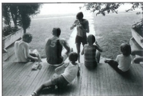
"Mi familia en el porche mientras como un helado hecho en casa". Wichita, Kansas, 1978