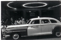
"Bibaco", 1952 © EDUARDO MOMEÑE

Eduardo Momeñe (Bilbao, 1952) es fotógrafo y ha escrito numerosos artículos y ensayos sobre estética fotográfica, aunque la esencia de la fotografía ha sido clave en su forma de entender la creación fotográfica. Ha impartido numerosos cursos, talleres y seminarios y entre sus alumnos se encuentran fotógrafos de reconocido prestigio. Proyectos tan importantes como la serie de televisión La Puerta Abierta o la revista Fotografías , realizadas en la década de los noventa, están consideradas como obras de referencia dentro de la difusión de la fotografía, con máximos, en nuestro país. Ha publicado el libro La Visión Fotográfica. Curso de fotografía para jóvenes fotógrafos , obra de la que en breve saldrá la segunda edición. Sus fotografías forman parte de colecciones públicas y privadas y desde la década de los 70 han sido expuestas en galerías e instituciones de diferentes países. Desde su estudio en Madrid ha realizado fotografías de moda, ilustración y retrato para revistas como Vogue , Marie Claire , Elle , AD o Style . Actualmente trabaja en las fotografías para una nueva exposición, en un nuevo libro sobre fotografía y en un vídeo documental sobre Europa.