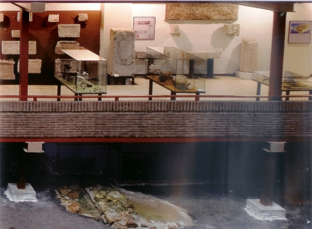
Necrópolis siglo IV-VII

este espacio a su programa anual de exposiciones temporales temáticas. Desde el museo se lleva a cabo una oferta de servicios basados en la difusión del conocimiento. Uno de los objetivos de este museo es contribuir a la educación permanente mediante actividades educativas, culturales y publicaciones divulgativas y didácticas. Al tiempo se promueven actividades científicas y formativas para dar a conocer las investigaciones de la ciudad. Así pues, estamos ante un museo vivo , cuyo único objetivo es mostrarse a toda la sociedad.