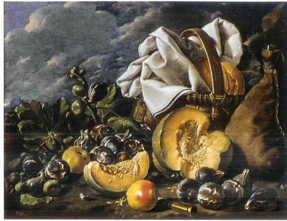
Luis Meléndez Bodegón con calabaza, manzanas, brevas, bota de vino y cesto

El conjunto de bodegones y floreros de la escuela española que posee el Prado es verdaderamente magnífico y, desde luego, el primero del mundo por la calidad y la cantidad de las piezas existentes. Es resultado de la propia historia del Museo, cuyos tesoros se han ido reuniendo a lo largo de varios siglos puesto que la institución se formó en principio con una gran parte de las Colecciones Reales, acumuladas por los monarcas españoles, recibiendo más tarde los fondos del Museo de la Trinidad, las compras del Estado y las donaciones y legados de particulares y de empresas. En cada uno de esos cuatro apartados hubo excelentes ejemplos de naturalezas