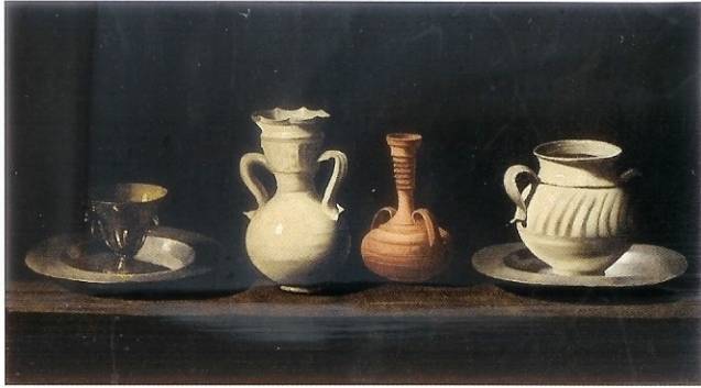
Francisco de Zurbarán Bodegón, ca. 1658-1664

En la presente exposición se realiza un recorrido por el sugestivo mundo de los bodegones y floreros de la escuela española, gracias exclusivamente a la riqueza de los fondos pictóricos del Museo del Prado, especializados en este género. Se ha tratado de una tarea en la que han primado los intereses científicos, en razón de la cuidada selección de piezas y el análisis pormenorizado de las mismas, así como las valoraciones de carácter estético, en la medida en que la búsqueda de un concepto de belleza en la representación ha dado lugar a la consecución de un atractivo repertorio de obras.