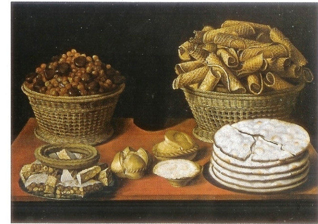
Tomás Hiepes Dulces y frutos secos sobre una mesa

La pintura de bodegones contribuye a establecer una de las múltiples facetas de la imagen histórica que se tiene de España, merced al punto de vista que ofrecen sus temas del día a día, en este caso los alimentos, los objetos de cocina y los utensilios caseros habituales, así como ciertas formas de las relaciones sociales, la gastronomía, las cocinas e incluso el ámbito de la decoración; además