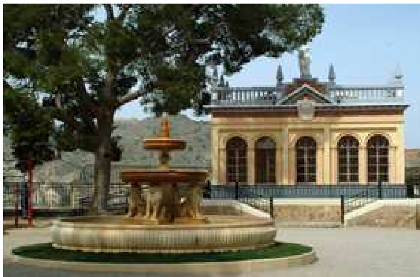
1. Paseo de la Ermita