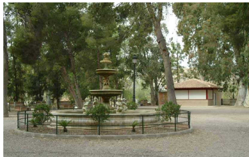
3. Parque Municipal