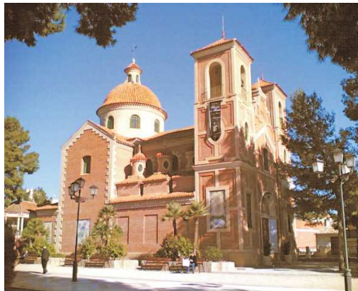
Crucificado de José Planes.