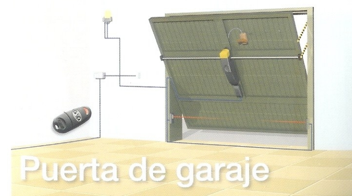
Puerta de garaje