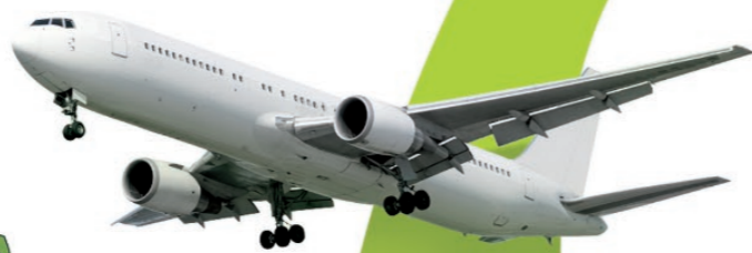
Aeropuerto Internacional El Altet- Alicante El Altet-Alicante International Airport

La ciudad de Alicante tiene accesos rápidos y cómodos tanto por vía férrea, marítima como aérea, además de una red de carreteras que comunica directamente con las ciudades más importantes de España. Todo esto garantiza al visitante una excelente accesibilidad destacando la proximidad del aeropuerto internacional de El Altet-Alicante, que se encuentra a 10 minutos del centro urbano dando conexión internacional a la ciudad.