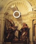
[10] Capilla de la Anunciación o de Jacobo de las Leyes (izda.)