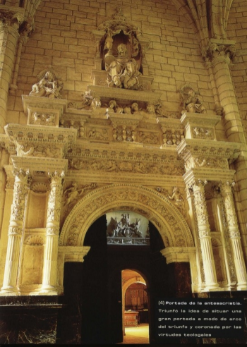
[4] Portada de la antisacristía. Triunfó la idea de situar una gran portada a modo de arco del triunfo y coronada por las virtudes teológicas