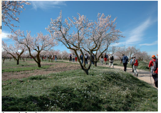
Campos de almendros.