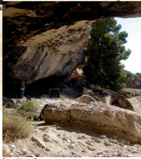
Cueva Negra, Fortuna.