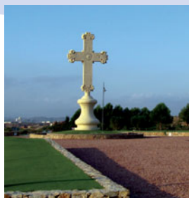
Cruz en Abanilla.