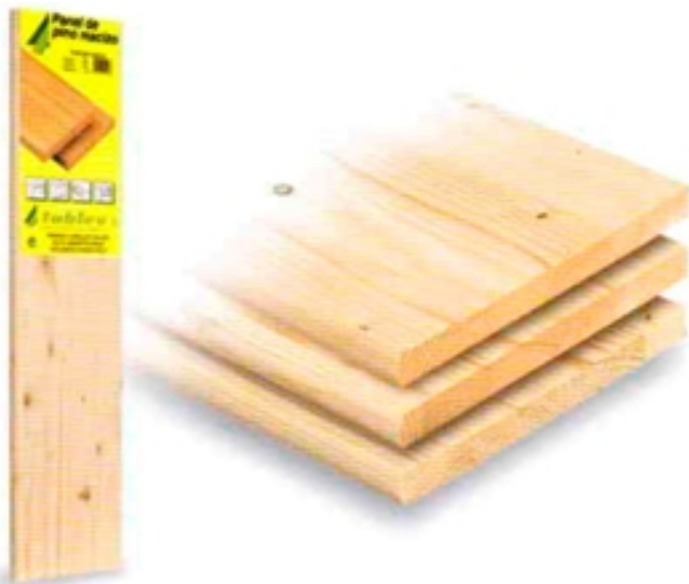
Balda abeto escandinavo / Whitewood edge glued panel / Etagère sapin du nord