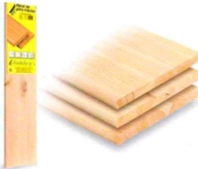
Balda pino rústico / Rustic edge glued panel / Etagère sapin rustique